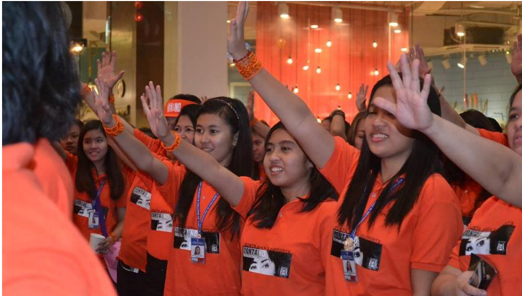
Zonta oranges the World, auch in Laguna, Philippinen.

Häusliche Gewalt, das ist eine von vielen Facetten der Gewalt an Frauen und Mädchen, die in Corona-Zeiten weltweit zunimmt. So erwarten die UN-Organisationen aufgrund der COVID-19-Pandemie weitere Millionen Fälle von Kinderheirat, weiblicher Genitalverstümmelung und ungewollter Schwangerschaft.